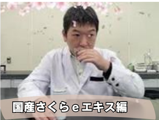
国産さくらeエキス編