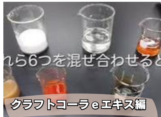
クラフトコーラeエキス編