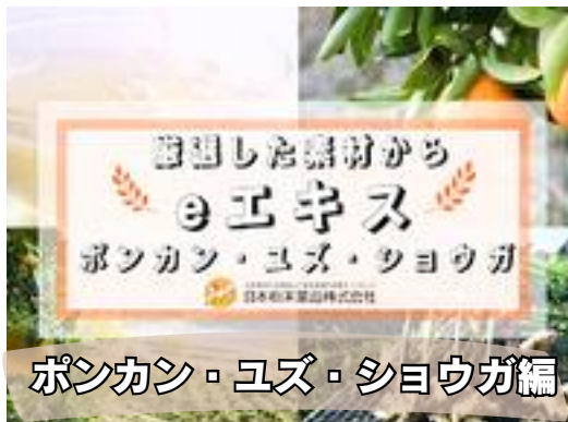
ポンカン・ユズ・ショウガ編